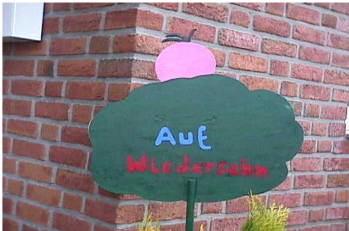
Wesel, im März 2008

Sie wird, angeregt durch Prozesse der Veränderung, ständig überprüft und aktualisiert werden. Wir hoffen, mit unserer Konzeption deutlich zu machen, dass Integration ein ständiger Prozess des Miteinanders ist, der nur gelingen kann, wenn sich ein jeder aktiv daran beteiligt.